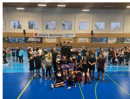
„Vánoční sportovní turnaj“