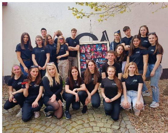
Poslední zvonění 4.A