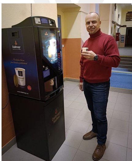
Nový automat na kávu ve vestibulu školy