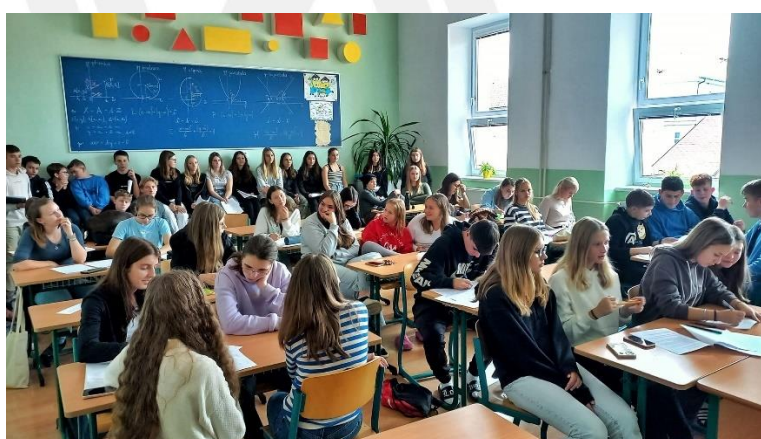
PROJEKT „VRAŽDA IGORA HNÍZDA“ – ŠKOLNÍ AKCE