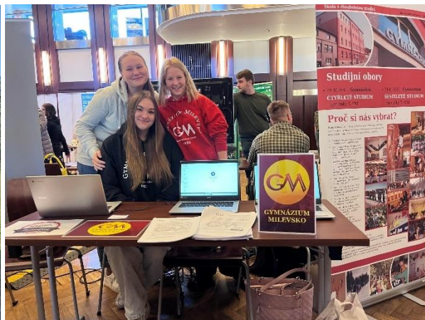
BURZA ŠKOL TÁBOR