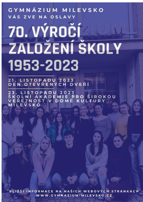
70. VÝROČÍ ZALOŽENÍ ŠKOLY

kancelar@gym.milevsko.cz http://gymnazium-milevsko.cz