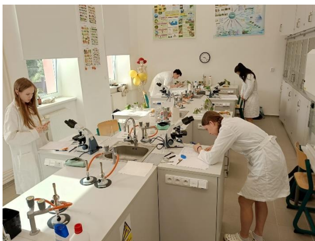
Praktická maturita z biologie