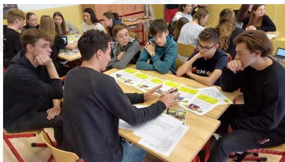
„Maraton psaní dopisů“