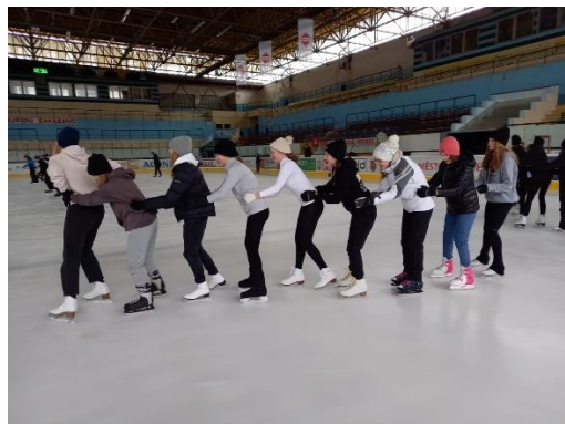
Hodiny TEV na zimním stadionu