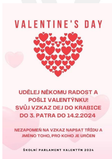
Školní akce „Valentine’s Day“