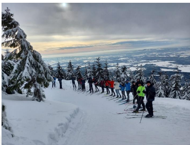
Lyžařský výcvikový kurz