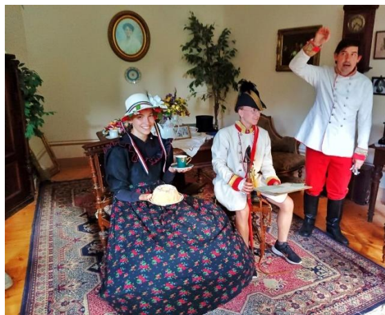
PROJEKTOVÉ DNY EVVO