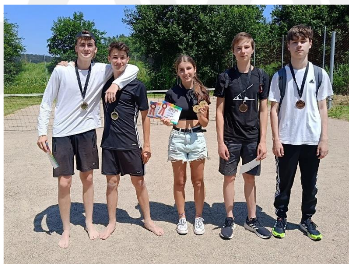
2. ročník turnaje v Pétanque