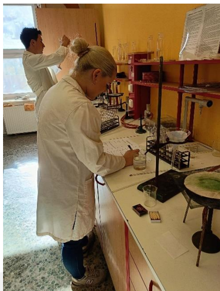
Praktická maturita z chemie