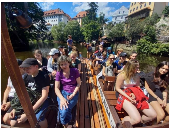
Projektový den „Český Krumlov...“