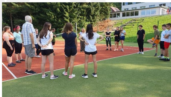
ADAPTAČNÍ KURZ Mozolov 1.A + prima