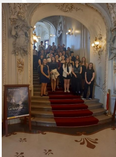
Projekt „DIVADELNÍ PRAHA“