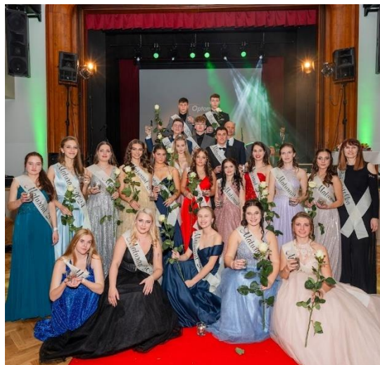
MATURITNÍ PLES 4.A