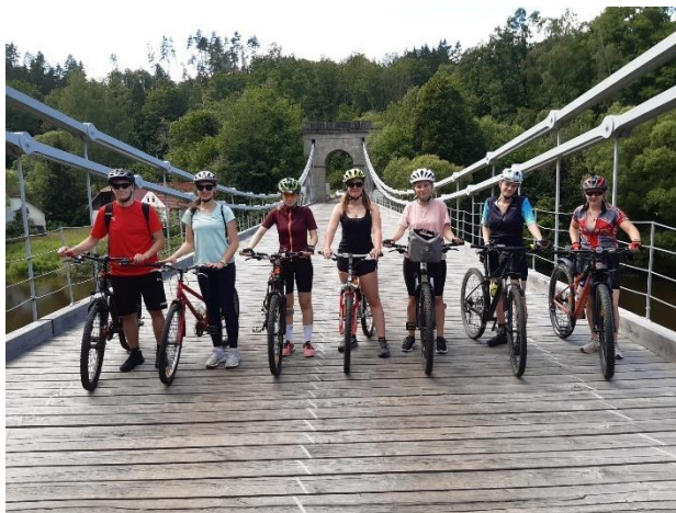
Sportovně turistický kurz (Stádlecký most)